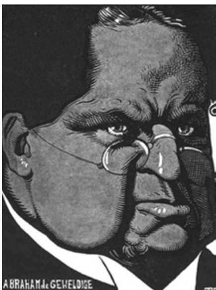
Abraham Kuyper was een geliefd object in de karikatuur, vooral van Albert Hahn.

Hij zette zijn bril ook tijdens volgende reizen nooit af en bleef zich bovendien altijd ter plaatse documenteren. Toen Kuyper als oud-premier in 1905 en 1906 zijn reis “rond de oude wereldzee” maakte, kwam hij telkens thuis met een dikke tas vol documentatie. Reizen was leren, voor Kuyper, hij deed het zijn leven lang. Als premier verrijkte hij tal van Kamerdebatten met inzichten die hij had opgedaan in landen als Zwitserland, Duitsland en Amerika. Altijd betrof het eigen waarnemingen en altijd onderbouwde hij zijn betoog met statistieken die hijzelf had opgeduikeld. Bijna elk dossier